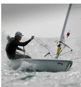
Laser Standard / Radial

30 euro la prima ora + 5 euro ogni mezz'ora successiva